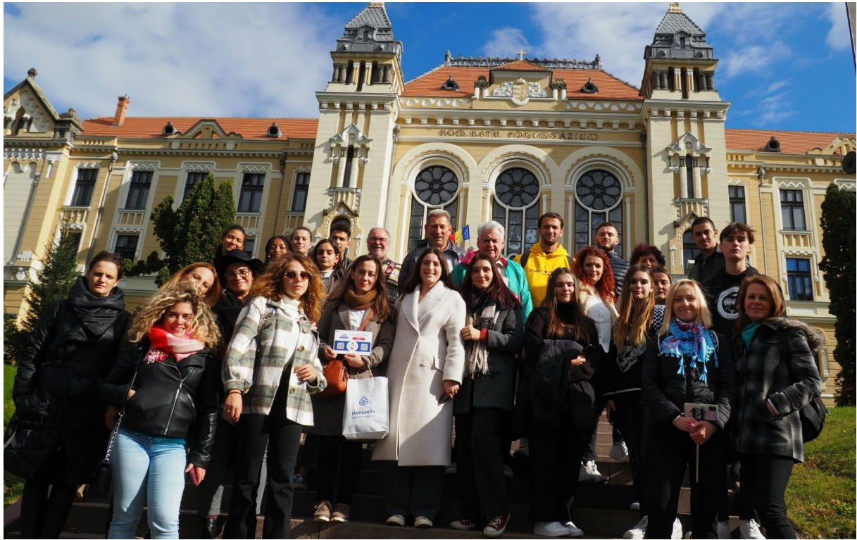
Photographie de groupe à Miercurea Ciuc lors de la chasse au trésors