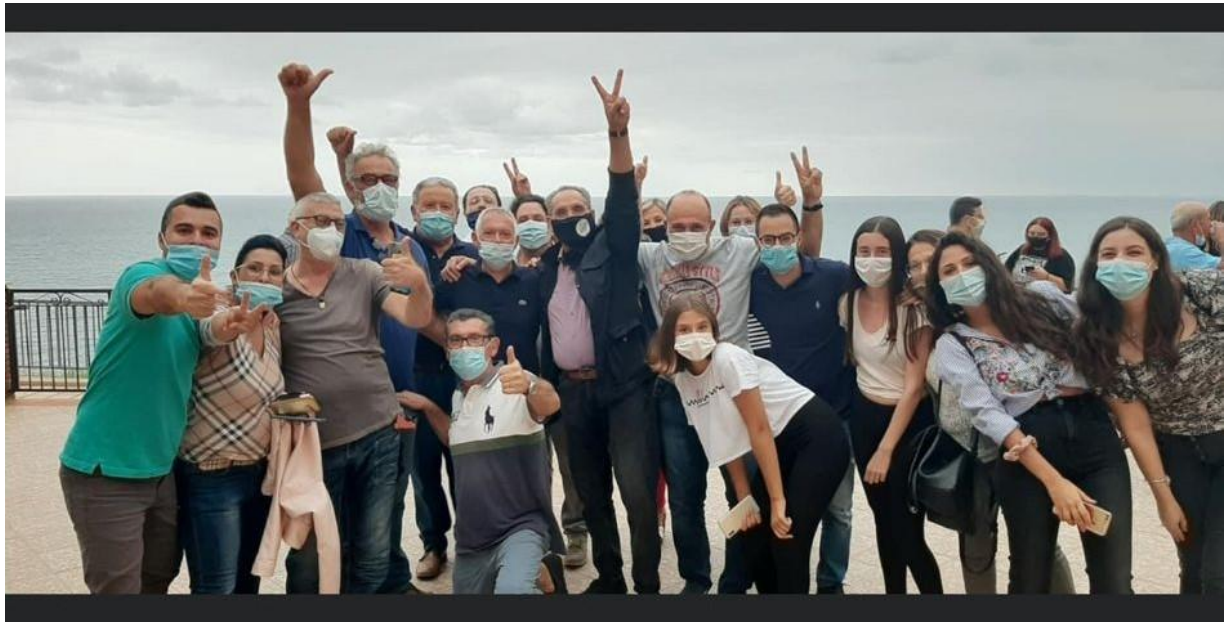
Photographie de groupe à Pollina en Italie