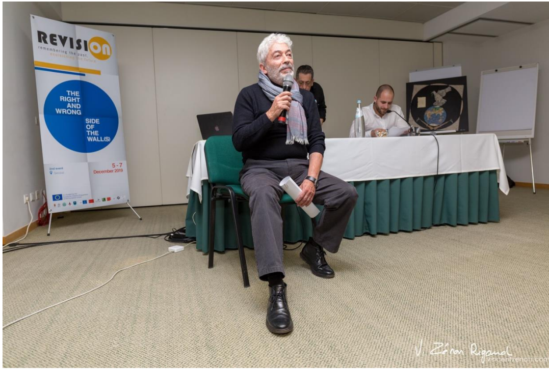
Photographie d'une intervention durant l'évènement #2 à Setubal, Portugal