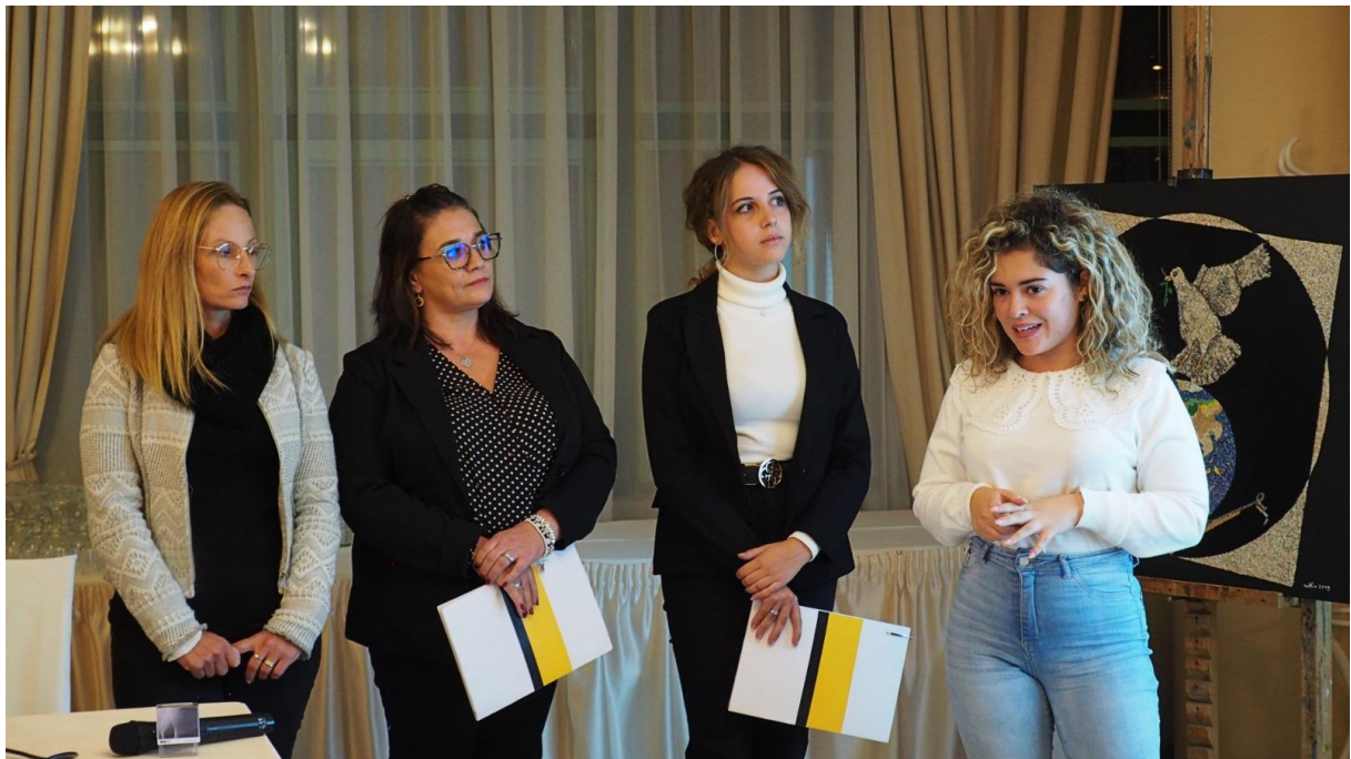
Photographie d'une intervention de la délégation italienne « Tell your Story contest » à Miercurea-Ciuc, Roumanie