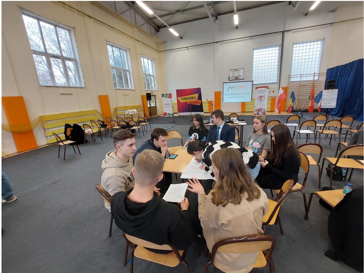
Photographie : Workshop / travail en groupe dans le Lycée #1 à Starachowice, Pologne