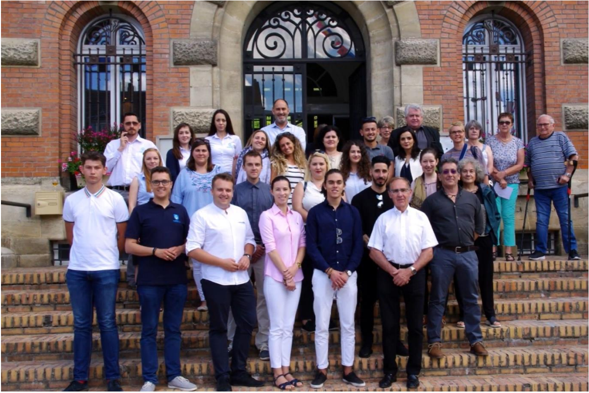
Photographie de groupe à Haybes, France