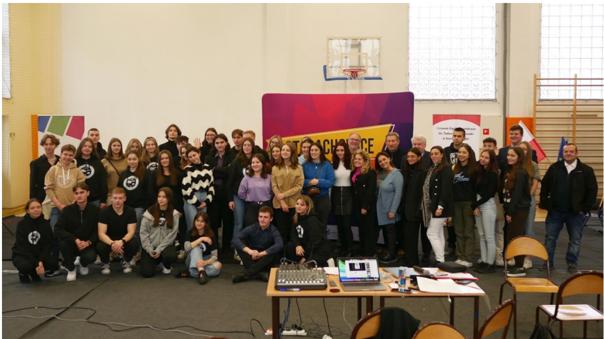
Photographie de groupe à Starachowice, Pologne

Photographie d'un Article de L'Union du 3 Juillet 2019 au sujet du projet et de l'évènement à Haybes