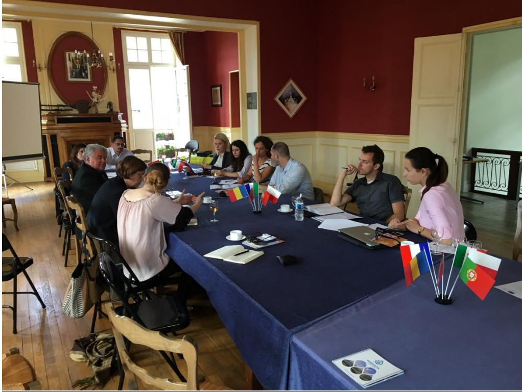
Photographie : Réunion de travail à Haybes