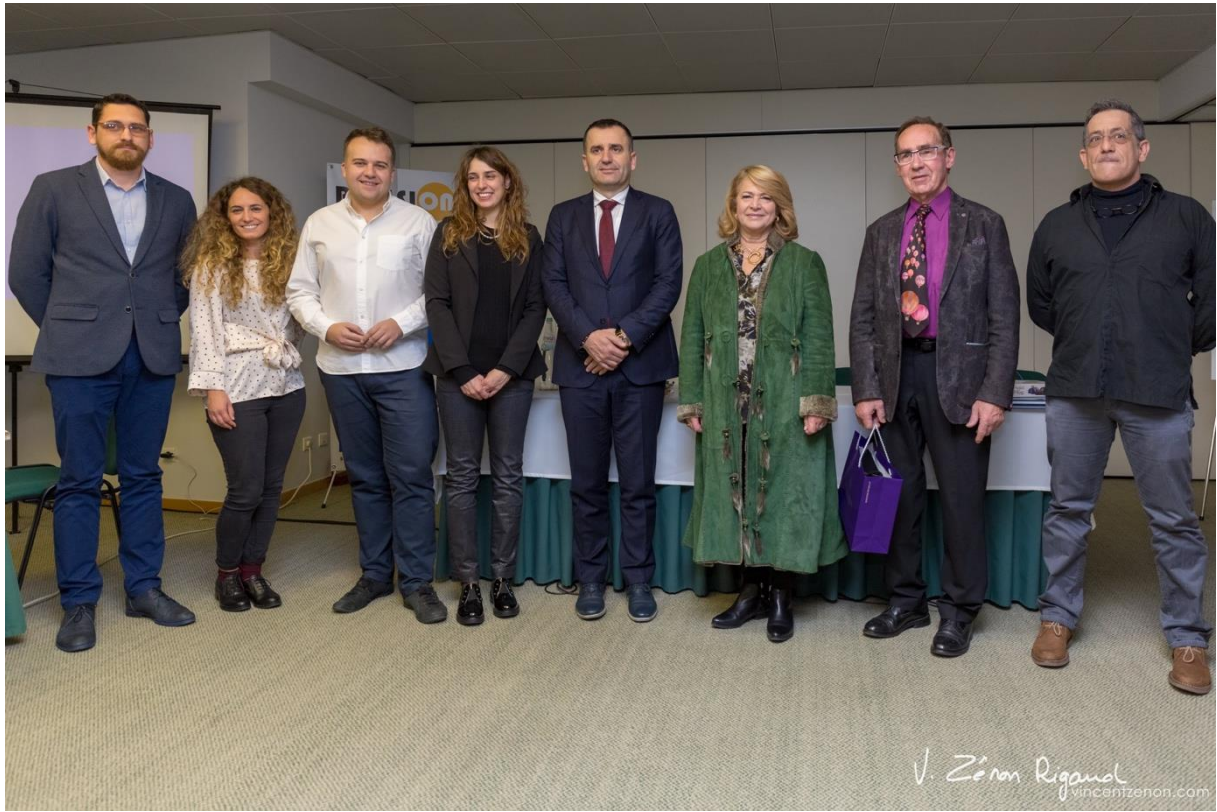
Photographie de groupe (représentants des organismes et villes participantes) à Setubal, Portugal