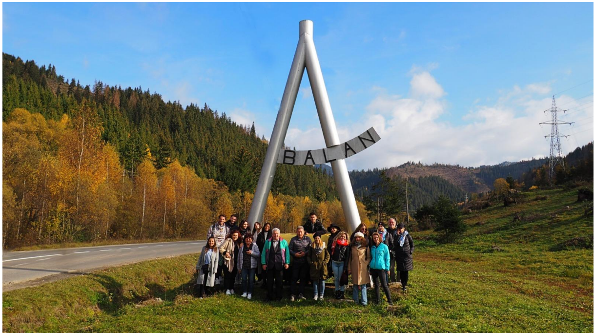
Photographie de groupe à la sortie de Balan, dans le comté de Harghita en Roumanie