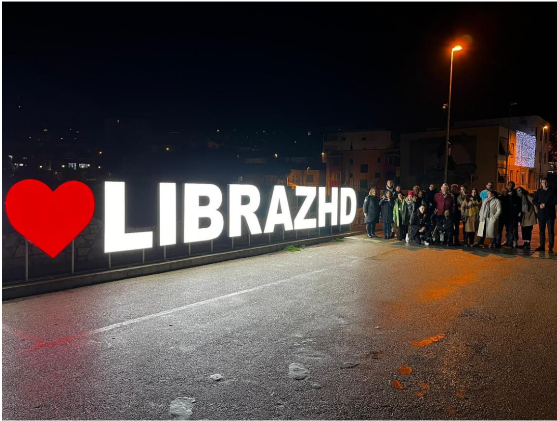
Photographie de groupe à Librazhd en Albanie