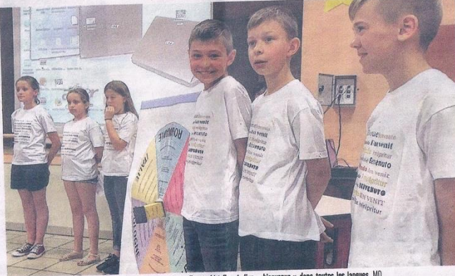
Les élus du conseil municipal jeunes de Haybes étaient vêtus d'un t-shirt floqué d'un « bienvenue » dans toutes les langues. MD

ment baptisé L'Europe pour les citoyens. L'idée est simple : « Chaque ville qui a accepté de participer devait choisir un point fort de son histoire, puis venir avec les jeunes de son secteur et les amener à récupérer la mémoire de ce passé », résume Noël Orsat, le directeur de l'association Via Charlemagne qui copilote l'opération. Pour Haybes, qui a été totalement détruite en 1914, le côté historique était tout trouvé. « On est parti de ce