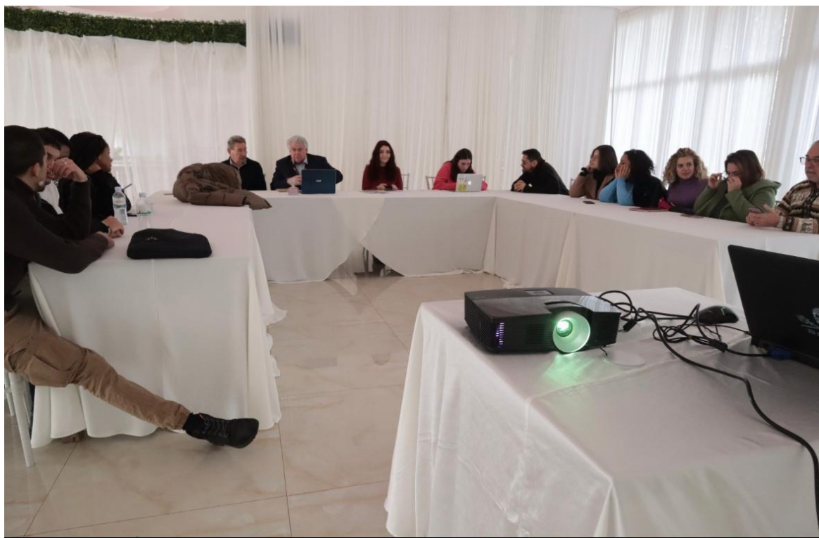
Photographie : Réunion de travail à Librazdh, Albanie